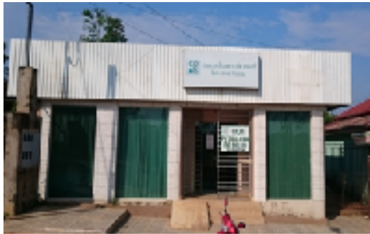
ADMINISTRACION SUB ZONAL DE COBIA