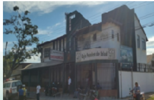
ADMINISTRACION ZONAL TRINIDAD