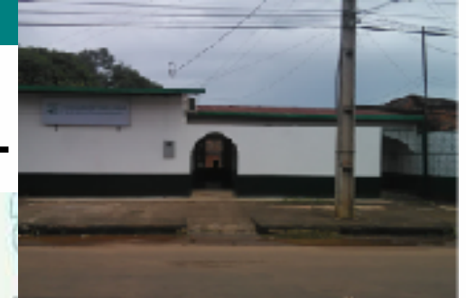
ADMINISTRACION SUB ZONAL DE GUAYARAMERIN