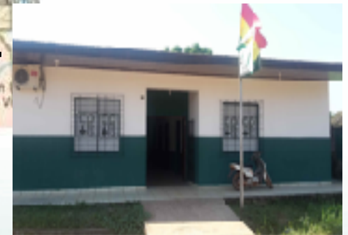
ADMINISTRACION SUB ZONAL DE RIBERALTA