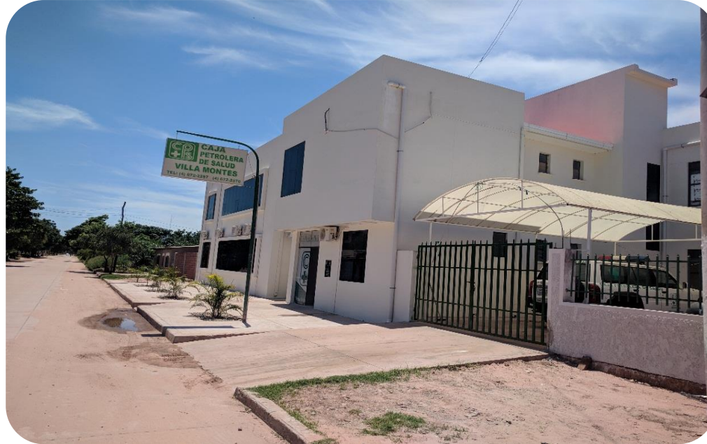
CAJA PETROLERA SUB ZONAL VILLA MONTES